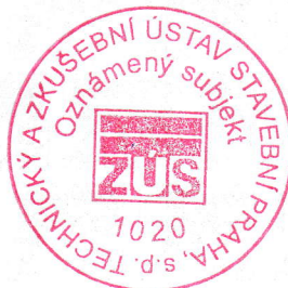
Ing. Vojtěch Šebek zástupce vedoucího oznamovaného subjektu 1020

Upozornění: Bez písemného souhlasu zástupce vedoucího oznamovaného subjektu se tento protokol nesmí reprodukovat jinak, než celý.